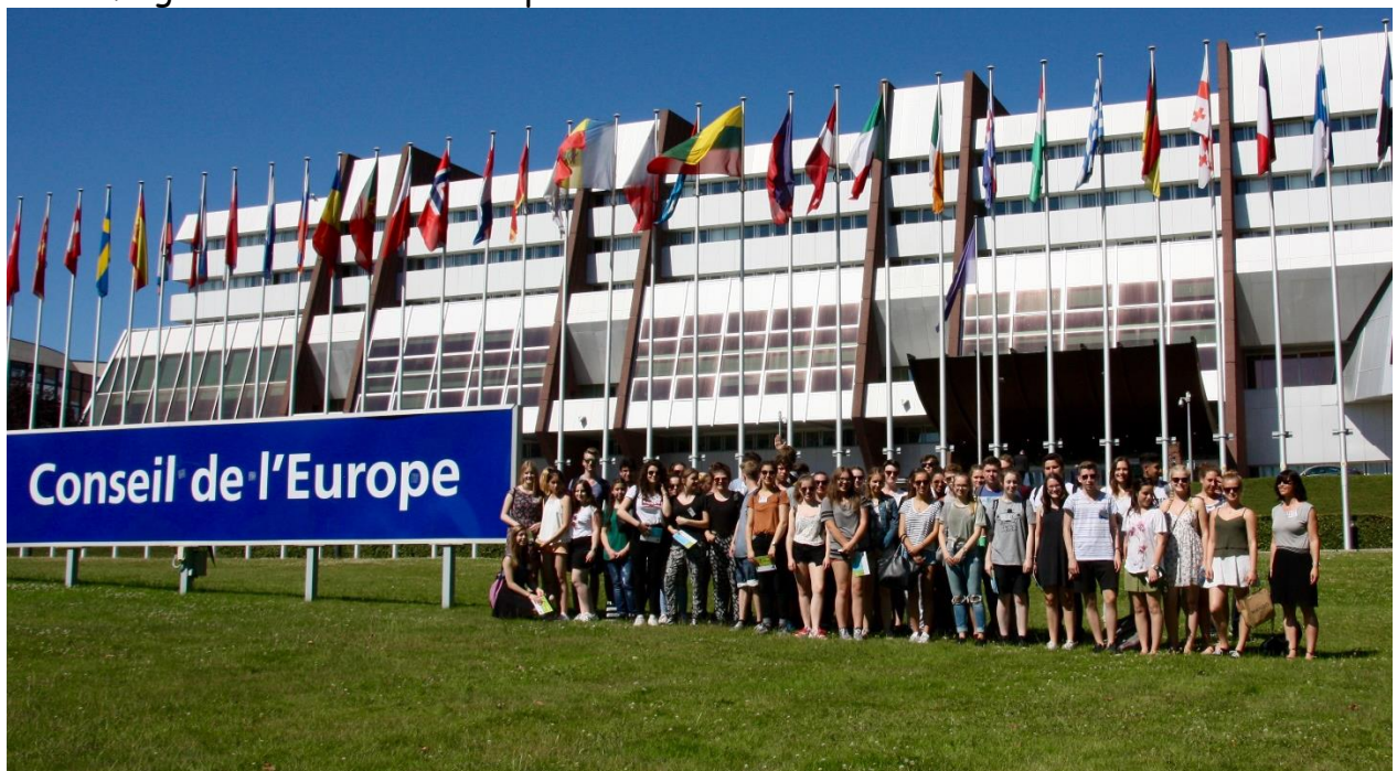
Impressionen von der Europafahrt nach Straßburg.

Da das RGW eine von insgesamt 227 Europaschulen in Nordrhein-Westfalen ist, spielt der europäische Gedanke und die Erziehung der Schülerinnen und Schüler zu mündigen Bürgern Europas im gesamten Schulleben eine Rolle. Gerade der Fachschaft Französisch liegt der europäische Gedanke am Herzen und so bieten wir - zusätzlich zu unseren Austauschmöglichkeiten - in der Jahrgangsstufe 9 eine Fahrt nach Brüssel oder Straßburg an. Dort besuchen wir z.B. das Europäische Parlament oder den Europarat, wodurch die Schülerinnen und Schüler die Möglichkeit erhalten, in die einzigartige Atmosphäre der europäischen Institutionen einzutauchen, die Arbeit der Parlamentarier in einer Plenarsitzung zu verfolgen und somit die europäische Union hautnah zu erleben.