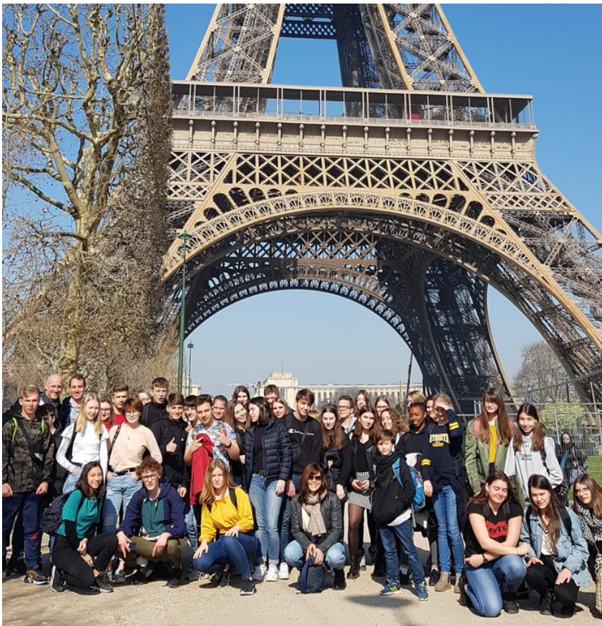
Impressionen vom Frankreich-Austausch mit Armentières

In der Jahrgangsstufe 9 haben die französischlernenden Schülerinnen und Schüler die Möglichkeit an einem Schüleraustausch mit dem Lycée Paul Hazard in Armentières (Nordfrankreich) teilzunehmen. Der deutsch-französische Schüleraustausch blickt auf eine lange Tradition zurück. Viele deutsche und französische Schülerinnen und Schüler haben so das Leben der anderen hautnah miterleben können. Die Schülerinnen und Schüler wohnen jeweils in den Familien ihrer Austauschpartner, das gilt gleichermaßen für Witten und Armentières. So besteht während der gesamten Dauer des Austausches die Möglichkeit, miteinander zu kommunizieren, die jeweils andere Kultur kennen zu lernen und Freundschaften zu schließen. Das Lycée Paul Hazard und das Ruhr-Gymnasium organisieren gemeinsam das Programm für den Austausch: Kennenlernen des französischen/deutschen Schul- und Familienlebens, Fahrten nach Paris, Lille und Köln oder Bonn, Stadtrallyes, sportliche Aktivitäten, Feten und vieles mehr.