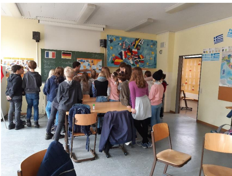
Impressionen vom Besuch des FranceMobil.

Aber warum lohnt es sich eigentlich Französisch zu lernen? → Link zu „Warum Französisch“ vom FranceMobil